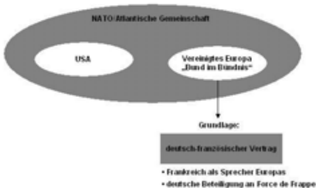
Grafik 2: Die Konzeption von Karl Theodor von und zu Guttenberg.

Aufgrund der Tatsache, dass sich diese beiden Konzeptionen mit Ausnahme der Frage, ob Großbritannien nun in den europäischen Integrationsprozess einbezogen werden sollte oder nicht, nahezu vollständig deckten und die Kerngedanken