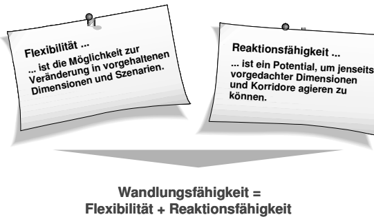
Abbildung 1-1: Definition der Wandlungsfähigkeit

Turbulenz beherrschen heißt folglich für die Unternehmen Mensch, Organisation und Technik in eine wandlungsfähige Aufbau- und Ablauforganisation einzubetten (REINHART U.A. 1999, S. 20ff; LAY U.A. 1997; TUSHMAN & O' REILLY 1998, S. 30ff; DÜRRSCHMITT 2001, MEIER U.A. 2004).