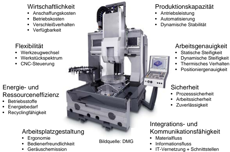
Bild 1.1: Anforderungen an moderne Werkzeugmaschinen (nach MILBERG 1995, WECK & BRECHER 2005, ABELE & REINHART 2011)

zen zu können. Hierfür stellt die gekoppelte Betrachtung des Finite-Elemente-(FE)-Modells der mechanischen Struktur mit der regelungstechnischen Simulation der elektrischen Antriebssysteme einen geeigneten Ansatz dar (BERKEMER 2003, OERTLI 2008). Die Erweiterung des gekoppelten Systems um das Modell eines Bearbeitungsprozesses vervollständigt den virtuellen Prototypen und ermöglicht die Simulation realer Betriebszustände im Zeitbereich. Auf diese Weise lassen sich die Wechselwirkungen zwischen der Maschinenstruktur und dem Zerspanungsprozess vorhersagen und Aussagen bezüglich der Prozessstabilität ableiten (WITT 2007, SCHWARZ 2010).