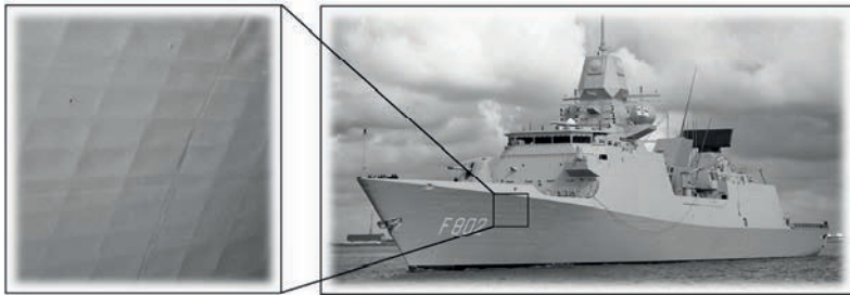
Abbildung 2: Schweißverzugsproblematik bei der Fregatte Hr. Ms. De Zeven Provinciën (Stapellauf April 2000); innenliegende Quer- und Längsstreben zeichnen sich schachbrettartig auf der gesamten Außenhülle ab (links); Resultat: erhöhte(r) Radarsignatur und Strömungswiderstand [VAN DER AA 2007, S. 2]

Neben den schweißbedingten Eigenspannungen ist der Schweißverzug eine problematische Störgröße in der Fertigung. Erschwert wird diese Situation durch den allgemeinen Leichtbautrend. Dünne Bauteile neigen aufgrund ihrer geringeren Steifigkeit im Fügeverbund stärker zu schweißbedingten Verzügen als dickere Strukturelemente [HUANG 2006, S. 1]. Die Auswirkungen von Schweißverzug auf eine verkehrstechnische Struktur in Leichtbauweise sind in Abbildung 2 zu sehen.