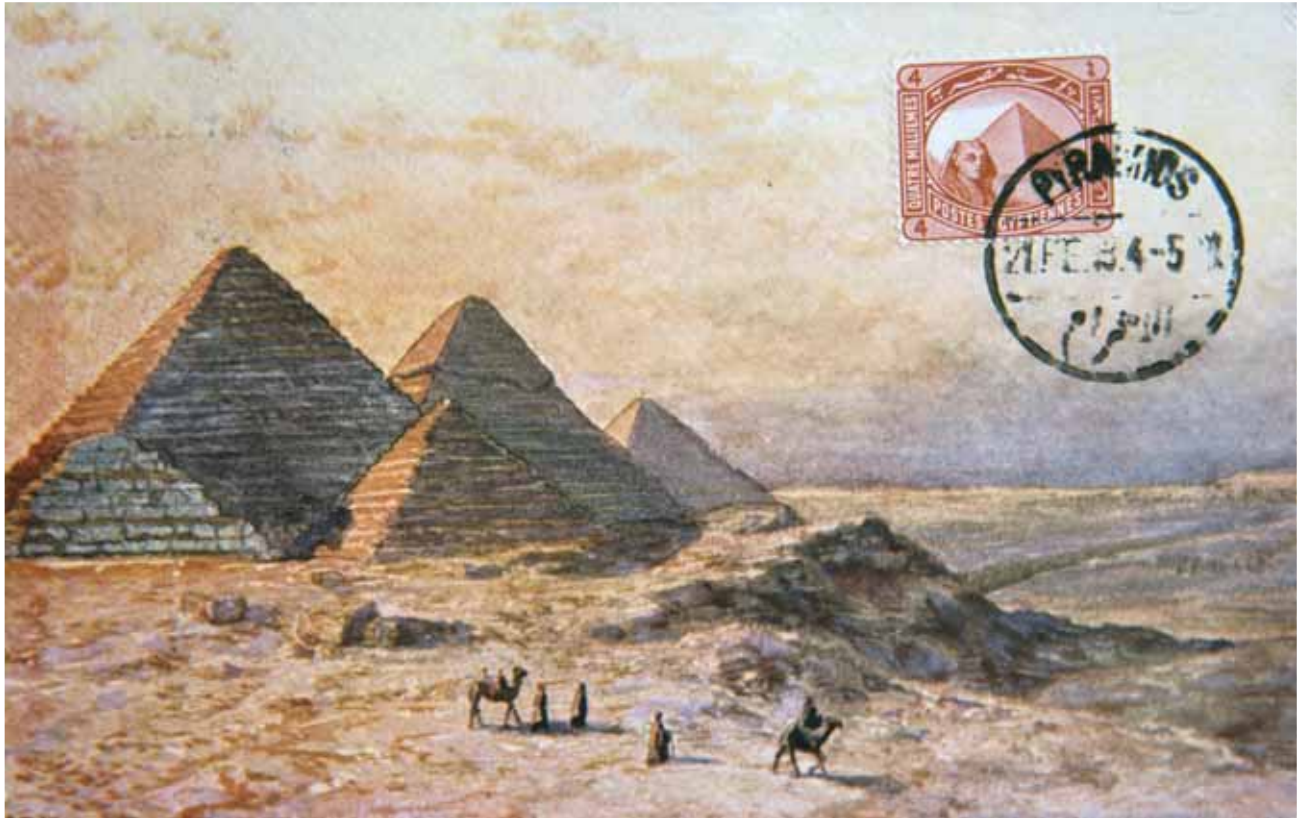
Pyramiden mit Wanderern