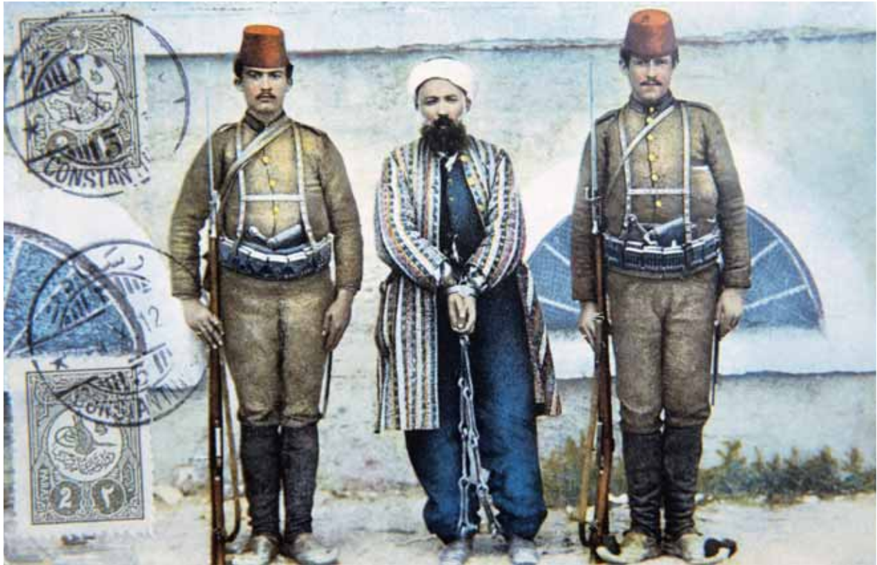
Gefangener in Ketten