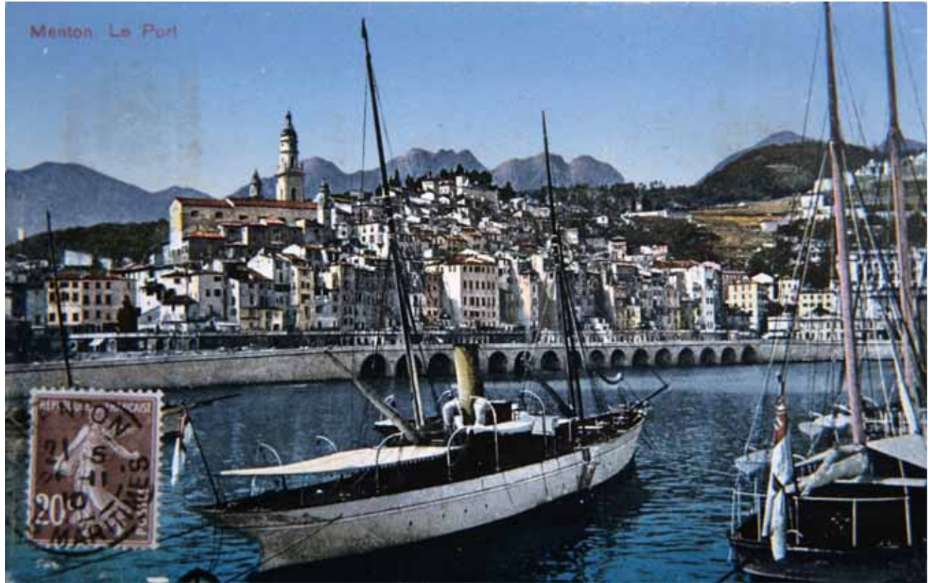
Hafen von Menton