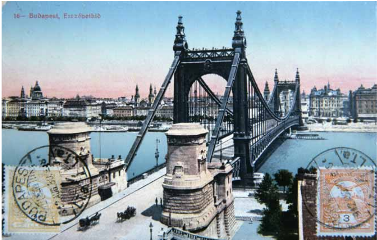
Brücke in Budapest